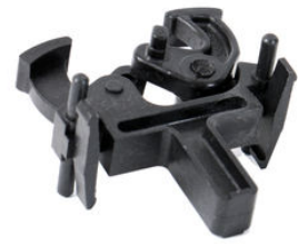
fig. 1. Abmessungen (mm)